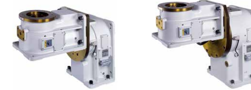
DREH-/KIPP-POSITIONIERER RJR SERIE