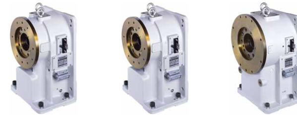
DREH-POSITIONIERER RJB SERIE