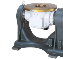
DREH-/KIPP-POSITIONIERER RJC SERIE